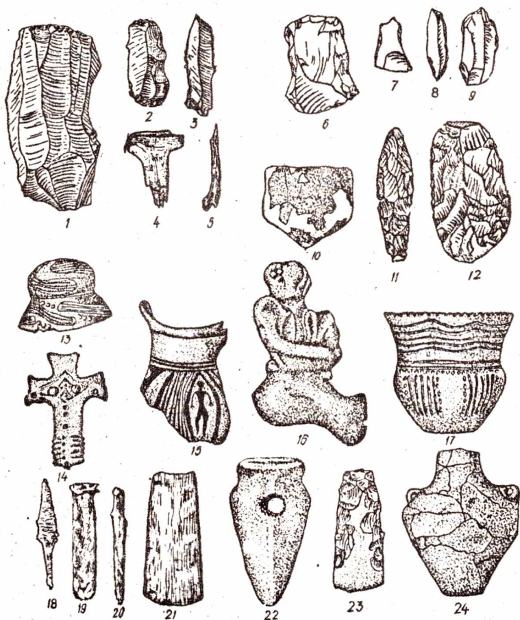
Рис. 1. Пізньопалеолітичні знаряддя праці з кременю (1-3) кістки (4-5). Мезолітичні крем'яні знаряддя праці (6-9). Глиняна посудина (10), крем'яні знаряддя праці (11, 12) дніпро-донецької культури. Глиняний посуд (13, 17, 24), вироби з міді (18-21), кременю (23), каменю (22) та предмети пластики (14-16) трипільської культури. 1-5 - Добранічівка; 6-9 - Козинці; 10-12 - Грині; 13, 14, 16 - Верем'я; 15 - Ржишів; 17 - Чапівка; 18-23 - Софіївка; 24 - Черняхів.