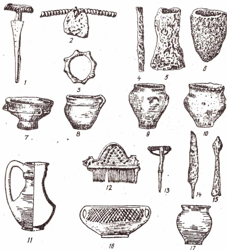
Рис.3. Вироби з пам'яток зарубинецької культури: Бронза: 1 - фібула; 2 - підвіска; 3 - кільце. Залізо: 4 - зубило; 5 - сокира. Глина: 6 - тигель; 7-10 - посуд. Виро- би з пам'яток черняхівської культури: 11 - глиняний глек; 12 - кістяний гребінець; 13 - бронзова фібула; 14, 15 - залізні ніж та дротик; 16, 17 - глиняний посуд. 1, 2, 7-10 - Пирогів; 3, 5, 6 - Таценьки; 4 - Лютіж; 11, 15 - Ромашки; 12-14 - Черняхів; 16, 17 - Переяслав-Хмельни- цький.