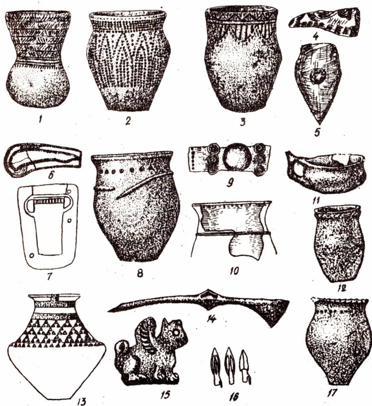
Рис. 2. Глиняний посуд середньодніпровської культури (1-2). Глиняний посуд (3), крем'яний серп (4), кам'яний молоток (5) тшчинецької культури. Диварська формочки доми бронзи (6, 7). Глиняний горщик сідогрудівської культури (8). Уламок бронзового браслета (9) та горщика (10) чернотської культури. Вироби скіфського часу (11-16). Горщик підгірцівської культури (17). 1 - Стрітівка; 2 - Козинці; 3-5 - Здвижівка; 6 - Голавурів; 7 - Мазепинці; 8 - Новосілки на Дніпрі; 9 - Лука; 10 - Боярка; 11, 12, 14, 16 - Трахтемирівка; 13 - Глеваха; 15 - Мар'янівка; 17 - Гребені.