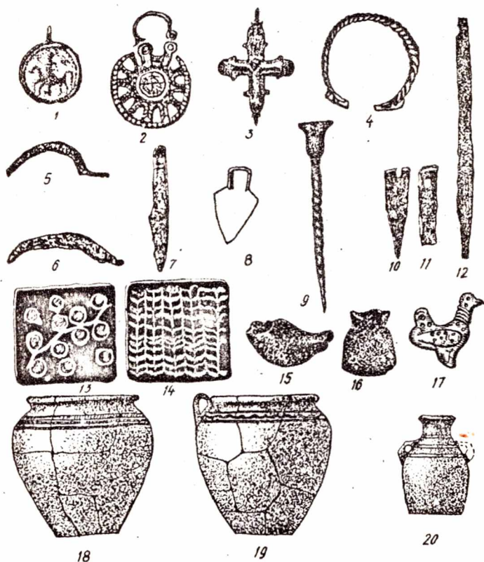
Рис.5. Вироби з давньоруських пам'яток: 1 - бронзова підвіска; 2 - срібний колт; 3 - хрест; 4 - срібний браслет; 5 - серп; 6 - коса; 7 - чересло; 8 - на- ральник; 9 - писало; 10, 11 - молоточки для карбування; 12 - напильний; 13-14 - полив'яні плитки; 15 - ллічок; 16 - глиняний тигельок; 17 - мідна матриця; 18 - 20 - глиня- ний посуд. 1 - Витачів; 2, 4 - Обухів; 3, 9-12, 15, 16 - Виш- город; 5-8 - Київщина; 13, 14 - Єлгородка, 17 - Чорнобиль; 18-20 - Ходорів.